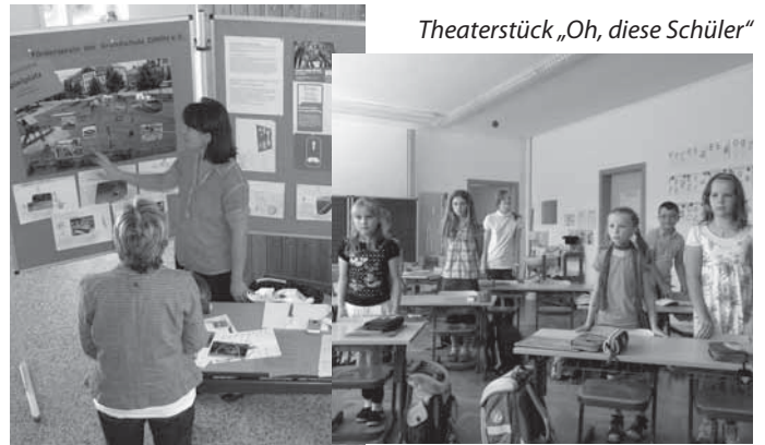
Theaterstück „Oh, diese Schüler“

Präsentation der Elterninitiative „Stadtspielplatz“ durch den Förderverein der Grundschule Zöblitz