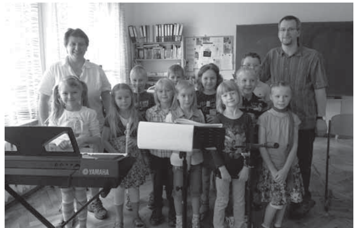
Musikprogramm der Klasse 1 (AG Flöte und Gitarre)