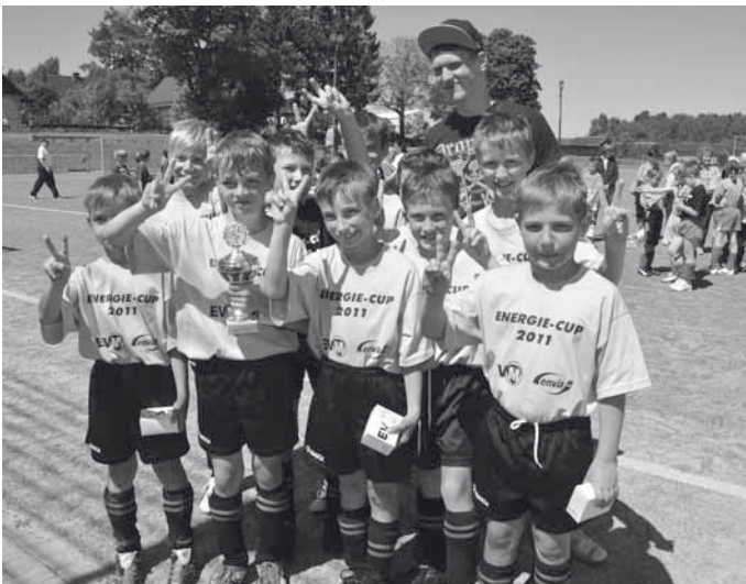
Turniersieger Grundschule Zöblitz

Somit löst das Team aus Zöblitz den Vorjahressieger Großruckerwalde ab und nimmt am 15. Juni 2011 am großen „Energie Cup 2011 Finale“ im Döbelner „Heinz Gruner Sportpark“ teil. Dort werden die Schüler um den Gesamtsieg des Turniers gegen die Vorrundensieger der anderen beteiligten Stadtwerke bzw. Energieversorger kämpfen. Ganz herzlich bedanken wir uns bei allen Schülern, Lehrern, Betreuern und Zuschauern für den erfolgreichen Tag. Ein großer Dank geht ebenfalls an den Platzwart Herrn Waldschog, an die Schiedsrichter des FSV Motor Marienberg, an die Sanitäter des DRK, an das AQUA MARIEN für die Verpflegung und an alle weiteren Beteiligten für die gute Zusammenarbeit.